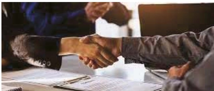
Realidade: Empresas subaproveitam as oportunidades contratuais

O contrato intermitente, por exemplo, é uma modalidade recente, que foi criada especialmente para atender ao setor de serviços, mas é muito pouco utilizado. Em novembro de 2022, o saldo de vagas intermitentes foi de 10.809 colocações, equivalente a 8% dos 135 mil postos de trabalho