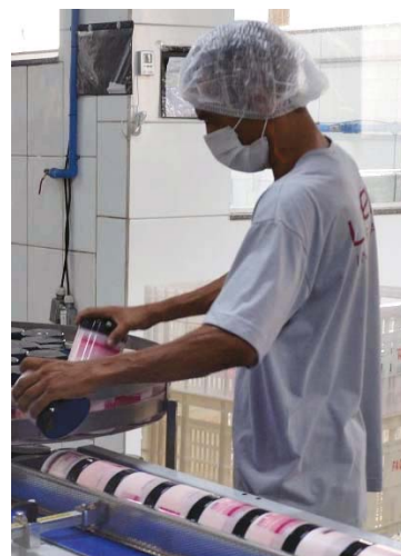
Economia: Balanço do Caged pode refletir cenário geral

A expectativa para o fechamento do primeiro semestre é de que os indicadores e a tendência se mantenha, pois o período de inverno envolve menos contratações temporárias que no verão. O CAGED divulga mensalmente os indicadores de emprego e desemprego.