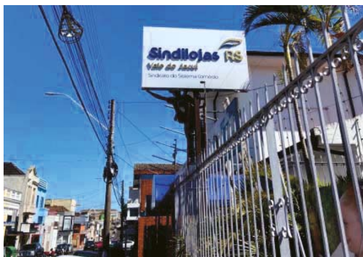
Reconhecimento: SINDILOJAS realiza tradicional evento regional

Acontece no dia 21 de julho, na sede do SINDILOJAS Vale do Jacuí , um dos maiores eventos empresariais da região, o Jantar do Dia do Comerciante, que homenageia personalidades e organizações que se destacam em suas comunidades por realizações e investimentos, que contribuem para o desenvolvimento econômico e social. Na ocasião, o SINDILOJAS entrega os troféus Personalidades Sindilojas e Mercador Princesa do Jacuí 2023.