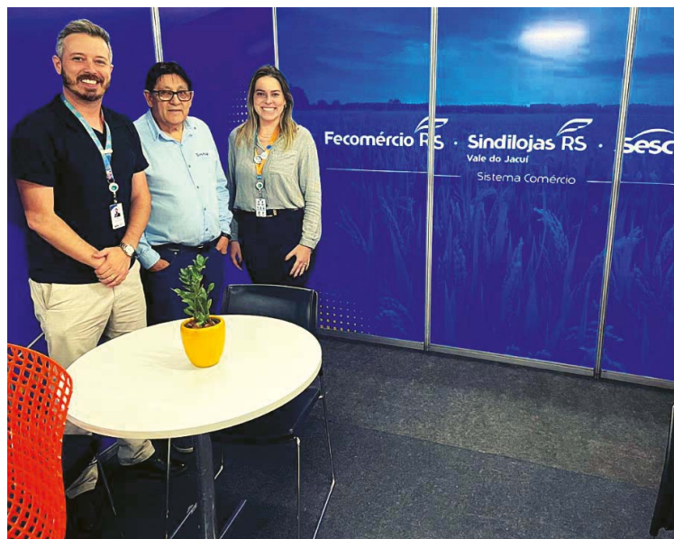
Institucional: SINDILOJAS, Sesc e Senac juntos na Fenarroz

O SINDILOJAS Vale do Jacuí faz a integração do Sistema Fecomércio-RS em Cachoeira do Sul, através de articulação com a sociedade civil e os poderes constituídos, realizando inúmeras atividades empresariais e sociais em sua sede, localizada no centro da cidade. Entre os destaques, a realização de encontros, mostras educacionais, palestras, workshops, seminários, entre outros.