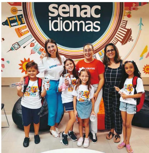
Nova língua: Aprendizado na infância traz vantagens

No curso para as crianças, o aprendizado ocorre de forma lúdica e divertida, desenvolvendo as habilidades: ouvir, falar, ler e escrever - aspectos fundamentais para o domínio real da língua. Sob a orientação de professores capacitados, o aluno é motivado a se expressar de forma natural, tendo a oportunidade de praticar o idioma. Durante os cursos de Idiomas do Senac, o estudante trabalha a criatividade e a