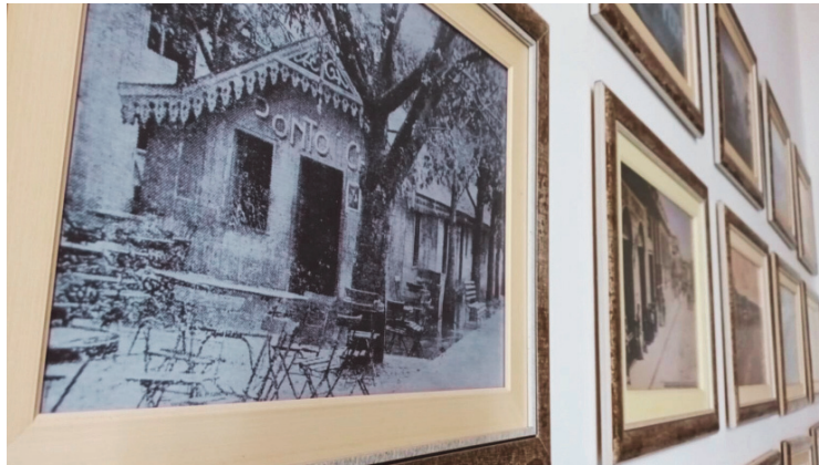
Memorial: Acervo está exposto junto ao auditório Rio Jacuí