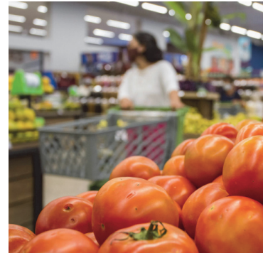
Impacto: Medida aumenta preços de itens da cesta básica

Os decretos terão algumas alterações. Dentro do conjunto de itens da cesta básica, o grupo alimentício de frutas, legumes e hortaliças e o grupo de ovos permanecerão com isenção de ICMS até o final de 2024, passando a serem tributados em 12% a partir de janeiro de 2025. A estimativa inicial do governo era de que as medidas previstas nos decretos representassem um aumento de arrecadação na ordem de R$ 1,3 bilhão. Com o adiamento de algumas delas, a expectativa é de aumento de arrecadação entre R$ 800 e R$ 850 milhões a partir dos decretos. Com a entrada em vigor das demais