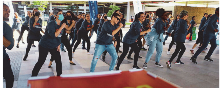
Saúde: Projeto mobiliza a sociedade para saúde e bem-estar

"Todos os anos, partimos do princípio de que o DDD tem que gerar o bem-estar. É um dia no qual podemos praticar atividades com amigos, mobilizar ações sociais e, principalmente, plantar uma sementinha de uma atitude positiva para sermos integralmente saudáveis. Nesse ano, além de deixar o legado na comunidade trazendo uma renovação para os espaços de lazer, queremos que o legado solidário seja um ponto de partida para lembrar do auxílio ao próximo, que deve ser